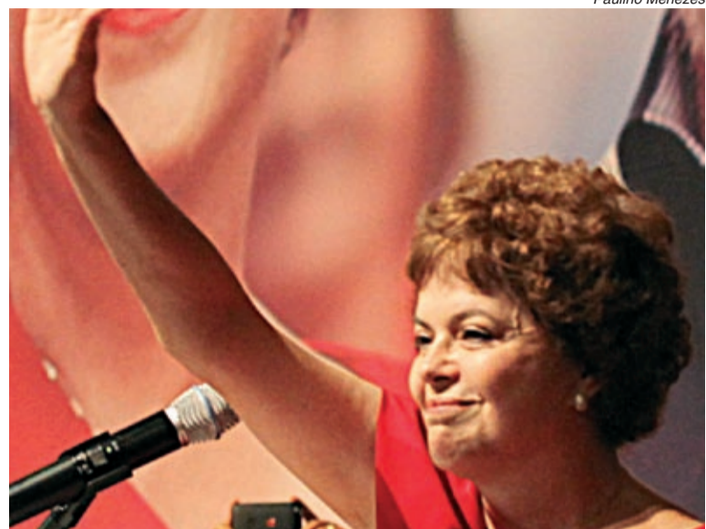
Cenário também é de empate entre Dilma e o tucano no segundo turno

A aprovação do presidente Lula foi de 72% para 73% de ótimo e bom, que é o recorde das pesquisas do Datafolha, iniciadas em 1990.